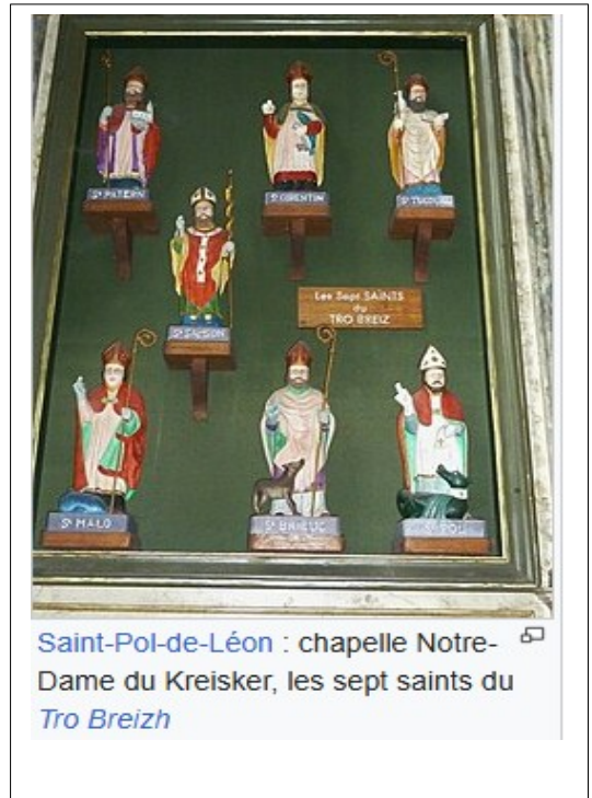
Saint-Pol-de-Léon : chapelle Notre-Dame du Kreisker, les sept saints du Tro Breizh